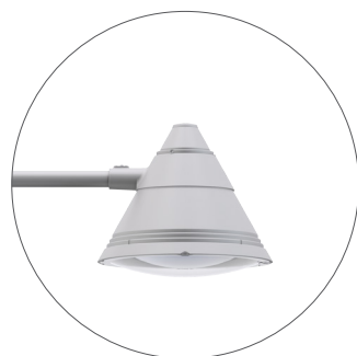
GC Gris claro