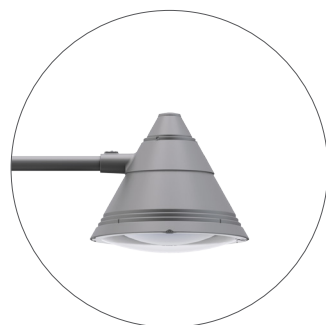
GO Gris oscuro