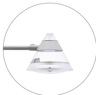
GC Gris claro