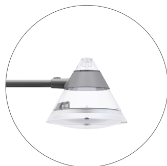
GO Gris oscuro