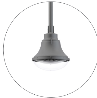
GO Gris oscuro