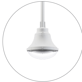
GC Gris claro