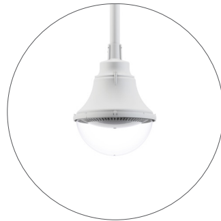
GC Gris claro