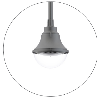
GO Gris oscuro