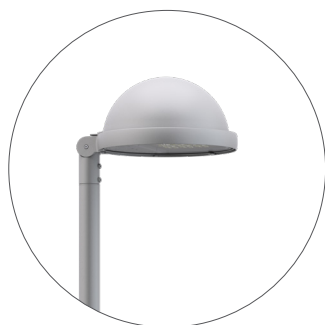
GC Gris claro