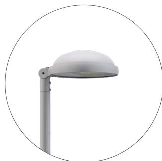
GC Gris claro