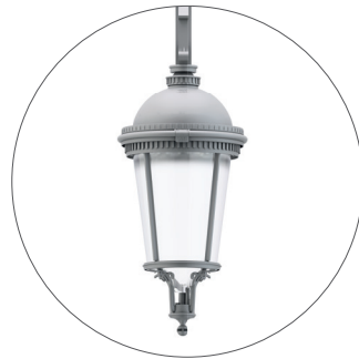
GC Gris claro