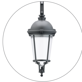
GO Gris oscuro