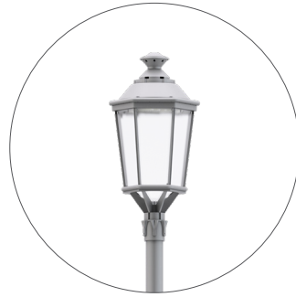
GC Gris claro