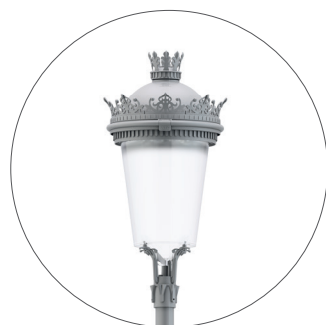
GC Gris claro