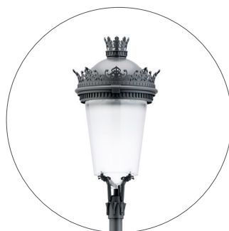
GO Gris oscuro