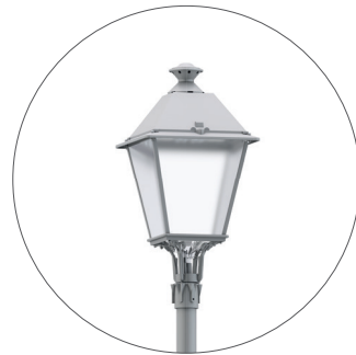
GC Gris claro