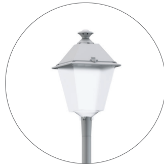
GC Gris claro